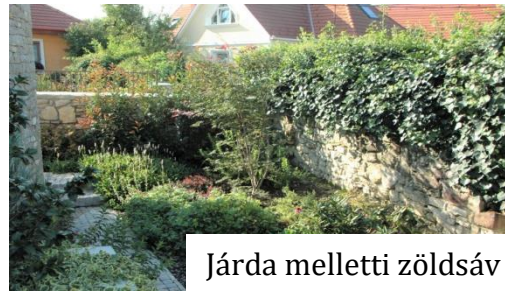
Járda melletti zöldsáv

A szakmai előkészítésnél a praktikus és egyben impozáns látványt nyújtó növénytelepítési megoldásoknak is szemponttá kellett válniuk, hogy az eltakarja a telket határoló tömör kerítést, a kültéri egységeket, az aknákat, illetve a szomszéd kertét. Fontos volt a könnyű fenntarthatóság kialakítása, ezért a növényágyásokat szegéllyel határoltuk és mulcsterítést alkalmaztunk.